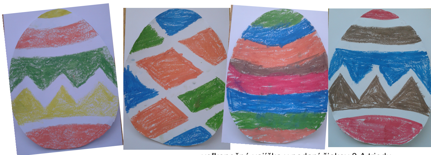
veľkonočné vajička v podaní žiakov 3.A triedy